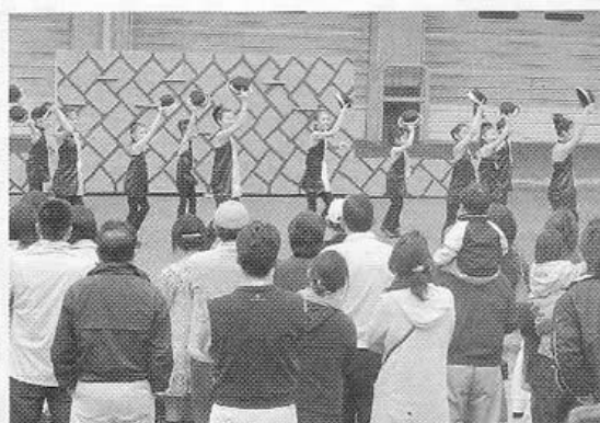
しばたパフォーミングキッズによるダンス

去る、4月13日(日)に新発田食品工業団地内で「第9回食品団地DE春まつり」が開催されました。当日は食品団地内の商品や飲食の販売、新発田商工会議所青年部主催のフリーマーケットやバンド演奏などのアトラクション、子供のぬり絵展示や抽選会など、終日を通して数多くのイベントが開催されました。