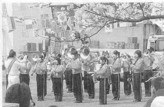
新発田中央高等学校吹奏楽部による演奏