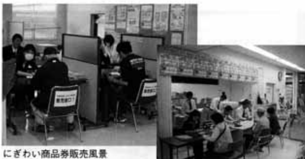
にぎわい商品券販売風景

万円、第二弾発行総額二億三千万円(第一弾は一千万円で一万一千円分の商品券、第二弾は一千万円で一万二千円共通券と、一万円で一万二千円専門券のセット販売)の商品券は、多くの市民にご購入頂き、第一弾においては販売開始二時間弱で完売しました。