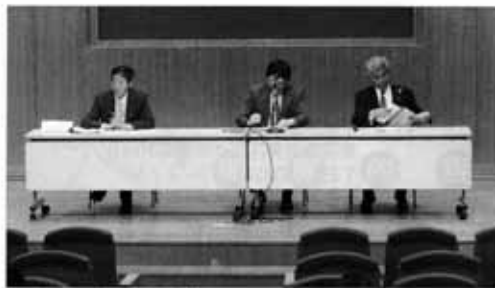
にぎわい商品券説明会

去る平成二十一年三月十九日、景気後退下における市民の暮らしへの支援、市内全域の商業者・商店街の活性化を目的に「新発田市にぎわい商品券推進委員会」を組織し、販売しました。「第一弾・第二弾新発田市にぎわい商品券」は、市内の事業所に加盟いただき、事業推進してきましたが、八月三十一日をもって無事終了することができました。