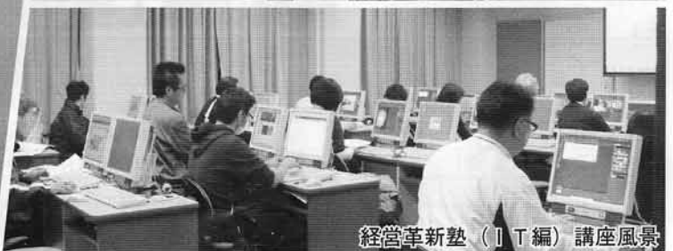
経営革新塾(IT編)講座風景