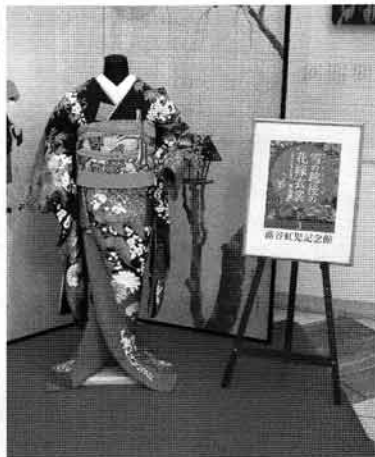
※展示作品は昨年のものです。