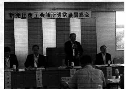
新発田商工会議所通常議員総会

当商工会議所は市内の経済情勢を市政に反映してもらうため市議会と当所部会との懇談会を開催するとともに、従来より推進している農工商連携事業や中小企業の活性化事業等を実施する中で、中心商店街の空き店舗対策や前年度発行のプレミアム商品券の効果もようやく表れてきていた。