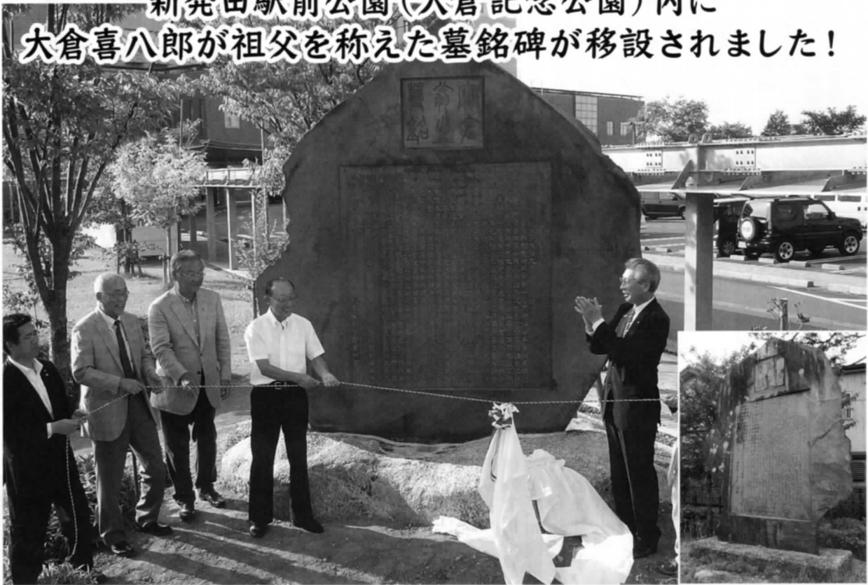
新発田駅前公園(大倉記念公園)に移設された墓銘碑の除幕式