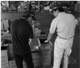
新発田青果サービス株式会社 競売前(競り)の物品確認

新発田市中央町三三七二 まちの駅二階 新発田商工会議所 (はつらつしごと館) 電話 二六六五〇五