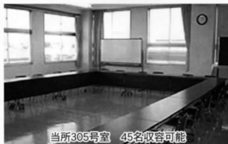
当所305号室 45名収容可能

TEL0254-2212757 http://www.shibata-ccior.jp