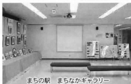
まちの駅 まちなかギャラリー