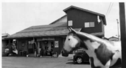
馬のお出迎え(店外写真)

①新発田市住吉町2-3-19 ②23-7208 ③10:30~19:00 ④水曜日 ⑤10台 http://www.new-deal1999.com/