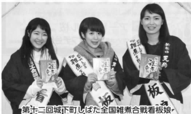
第十二回城下町しばた全国雑煮合戦看板娘