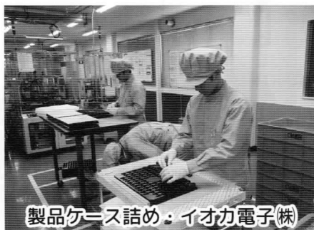
製品ケース詰め・イオカ電子(株)