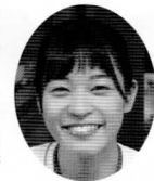
私がインターンシップに行き、学んだ事は仕事を楽しく事です。一日目、すごく緊張をしていました。私たちに明るく接してくれ、一気に緊張がほぐれました。本当に苦な事がなく、一秒一秒の時間が楽しくて、夏休みずっとインターンシップに行きたかったです。

私を店員さんだと勘違いをして質問をされたお客さんに、しっかりと答えることができた時の達成感は今でも忘れられません。プール監視業務の時は小さい子が話しかけてくれたりと、幸せな時間を過ごす事ができ、本当に最高の三日間でした。