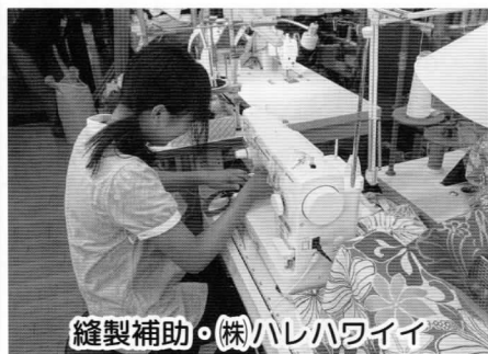
縫製補助・株ハレハワイイ