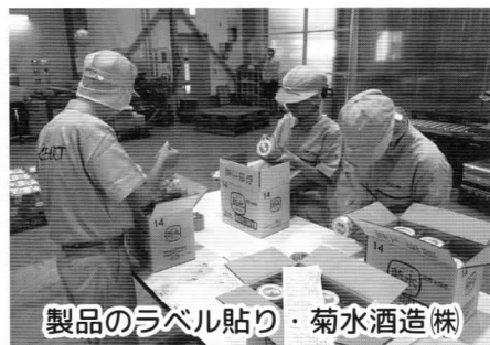
製品のラベル貼り・菊水酒造(株)