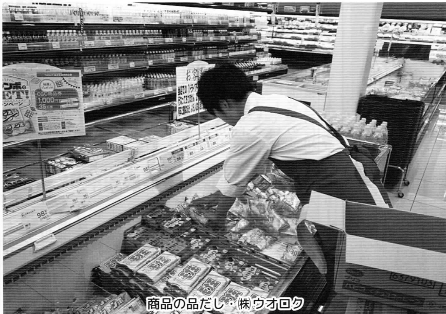
商品の品だし・株ウオロク