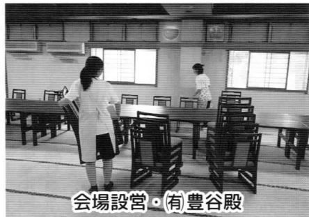
会場設営・有豊谷殿