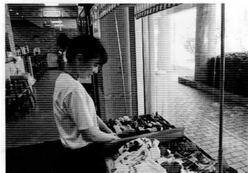
(株)紫雲寺記念館(紫雲の郷) 商品陳列作業

当所では、平成23年度から新発田市より受託事業である大学生・高校生の就業体験を行う「新発田インターンシップ事業」に、本年度から胎内市、聖籠町が参加し、二市・一町からの受託事業として、「新発田・胎内・聖籠インターンシップ事業」を夏季と秋季の2回行うことになりました。二市・一町が連携・協力し「圏域就職支援事業」として、企業の雇用確保と大学生・専門学校生・高校生の就業率向上を目指し取り組みます。当事業の趣旨をご理解いただき参加してくださいました企業・事業所のご支援・ご協力に心より感謝申し上げます。本年度は102企業・事業所から約400名の受入可能の申込みをいただきました。夏季は9月中旬迄、46企業132名の就業体験者を見込んでおり、秋季は10月中旬〜11月頃迄の実施を予定しております。