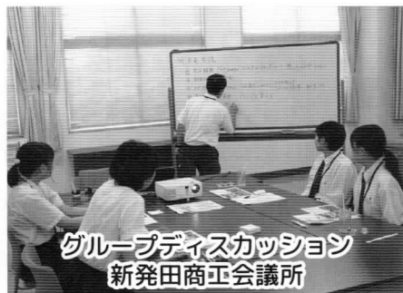
グループディスカッション 新発田商工会議所