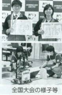
全国大会の様子等

私どもはこれからも実践 技能者を育成していきま すとともに、さらなる地域貢 献をめざし努力する所存で す。本年もどうぞよろしく お願い申し上げます。