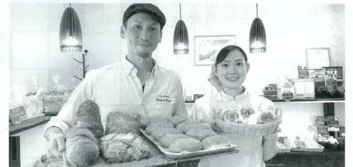
左からパン・ド・ロデヴ、カレーパン、グリルチキン

ズ・トマト・巻いたたつぷりのレタスをシーザードレッシングで味付けしてあります。ヘルシーで女性のお客様に人気で、巻いたレタスは断面萌えます。パン・ド・ロデヴは、シンプルなお味以外はパリッ、中はしっとり水分を含んだハード系のパンです。3月まで、各国の家庭で親しまれている週替わりスープ(木曜日変更230円・税込)を提供しています。伝統的かつ新しい商品を提供できればと思います。皆様のご来店をお待ちしております。