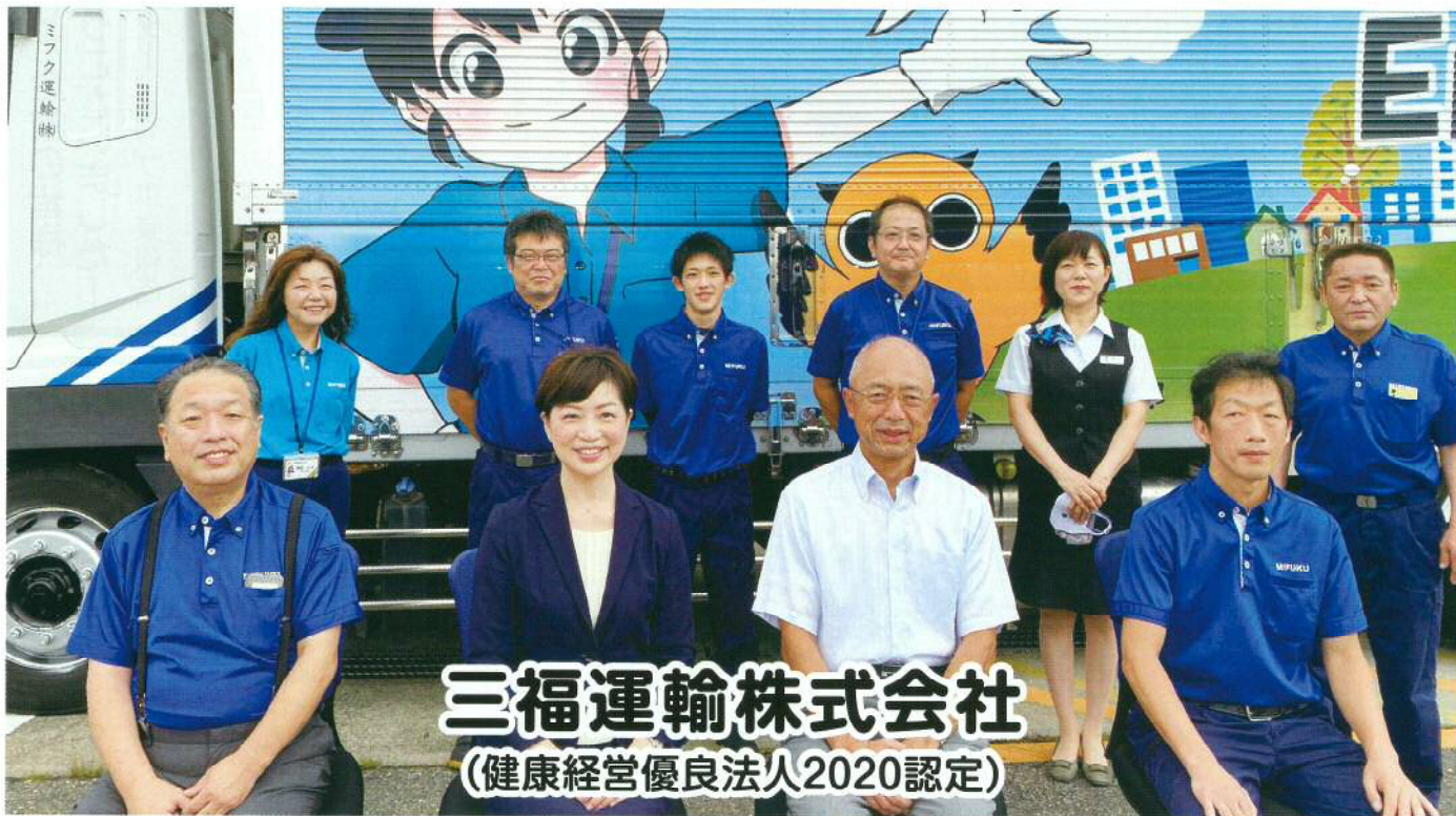
三福運輸株式会社 (健康経営優良法人2020認定)

住所 横岡116612 TEL 3312229 HP http://mfukunyu.jimdo.com