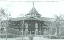
カトリック新発田教会

歴代の神父さまや信徒の皆さまなどの協力により、現在まで竣工時とほぼ変わらない姿で維持管理されており、日本建築家協会の「第5回JIA25年大賞」を受賞。平成28年には献堂50周年を記念するイベントも行われました。全国から見学者が訪れる注目スポットですが、教会として大切に利用されているため、見学には事前予約が必要です。現在、住居環境科の一年生は「レーモンド通りに住む」というテーマの課題に取り組んでいます。「教会の隣に住む」という設定では、家の中から教会が見えるような大きな窓を設ける、景観の邪魔にならないよう地下で暮らす、など多くのアイデアが生まれています。どのような住宅を計画するのか、学生による自由な発想を期待しています。