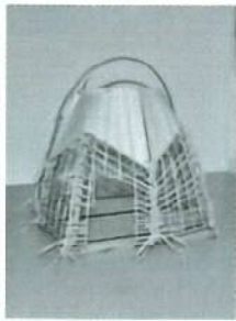
製作中の茶室の模型

です。デザインコンセプトは、実在する物の形をモチーフにして検討し、最終的に「宗全籠」という茶道で用いる花入れをモチーフにしてデザインしました。空間の規模は、平面が畳2枚分と小規模なものを計画しています。 詳細部の検討では、縮小模型だけではなく、実際に材料を加工して組み立てる手段も構想しています。使用する材料は、木材、竹、障子紙などです。竹は支柱や壁に用いて、壁は割った竹を編み込むような形で製作しようと考えています。 初めての試みも多く苦労もありますが、1月末までに完成させたいと考えています。今からどんな茶室ができるかとても楽しみです。完成したら当校のホームページやSNS等でご紹介させていただきます。