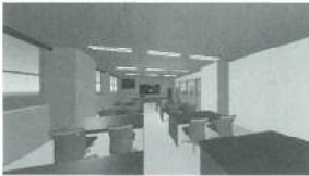
学校探索システム (バーチャル空間の実習室)

今年度も金魚台輪のバーチャル化など卒業制作で取り組んでいます。学生の自由な発想で制作するバーチャル空間を楽しみにしています。