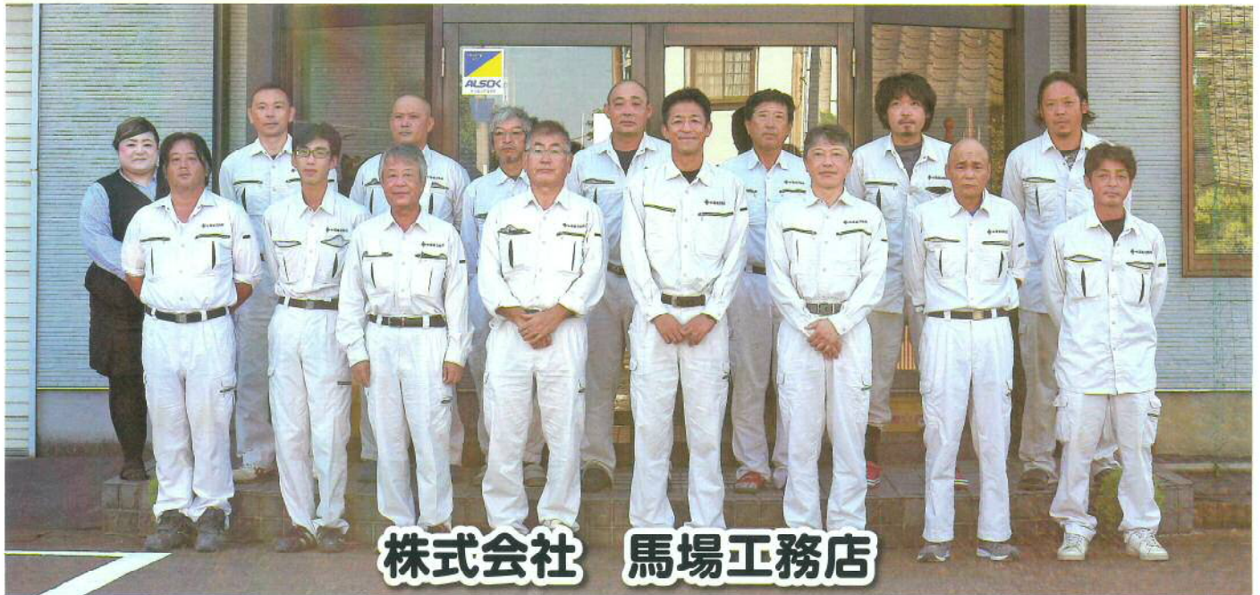
株式会社 馬場工務店

HP 電話 住所 営業時間 https://www.babakoumuten.co.jp 24 17612 浦901番地 8:00～17:00