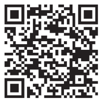
電子帳簿等保存制度 特設サイト

◎税制改正による要件緩和 システム対応が間に合わないといった相当の理由がある事業者等については、改ざん防止措置・検索機能の確保の要件が不要となり、「出力書面を保存」し、「税務職員から求められた際にデータで渡せる」状態にしておけば、多くの中小企業が従前の保存方法のままで良いこととされます。