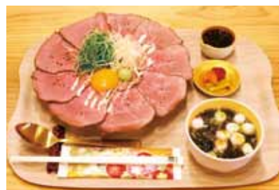
ローストビーフ丼

がっていたできます。お店はイトイン専門ですが、ちよこつとテイクアウトで、日替わりのお惣菜もご用意しています。どちらのお客様も心より歓迎いたします。駐車場も合計9台用意しておりますので、お気軽にお越しください。