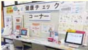
写真) まちなか保健室(健康長寿アクティブ交流センター内に設置)

★「まちなか保健室」で気軽にチェック! 街中での買物や用事のついでに立ち寄って利用しよう。企業向けにチェック機器の貸出もあり。健康経営に役立てよう。★定期的に健(検)診を受けよう。からだの変化に早く気づいて早めにケアしよう。